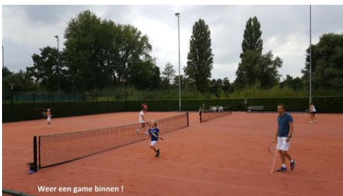
Weer een game binnen!

Onder bijna ideale weersomstandigheden heeft zondag 10 september het jaarlijkse familie (ouder-kind) toernooi plaatsgevonden. Met 72 deelnemers was een bonte mix van vaders, moeders, oma's, opa's en andere familieleden fanatiek in de weer om hun kroost of familielid te ondersteunen in de strijd om de eer van de familie. Het was een sportieve middag met mooie partijen op alle niveaus. Bij de allerjongsten (7-10 jaar) werd er fanatiek gestreden met echte lange rally's. In de