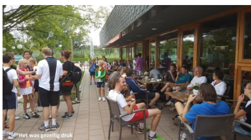
Het was gezellig druk

groep 11-14 jaar werd het loopvermogen van menig ouder(e) danig op de proef gesteld en bij de 15-17 jarige 'diehards' deed menig partij niet onder voor de partijen tijdens het GPT toernooi van een week geleden!