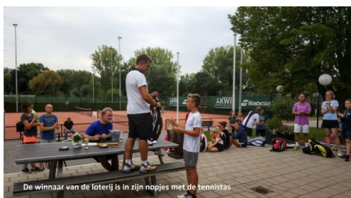
De winnaar van de loterij is in zijn nopjes met de tennistas